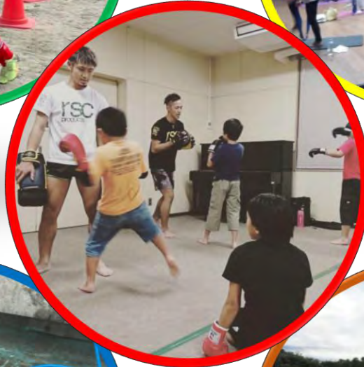
キックボクササイズ